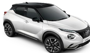
WHITE PEARL BRILLIANT /BLACK