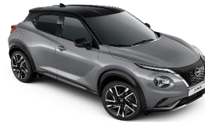
CERAMIC GREY /BLACK