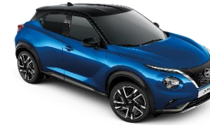
MAGNETIC BLUE /BLACK