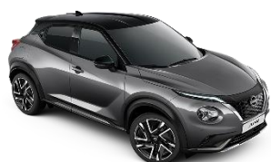
DARK METAL GREY /BLACK