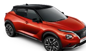
FUJI SUNSET RED /BLACK