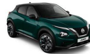
DEEP OCEAN/ BLACK