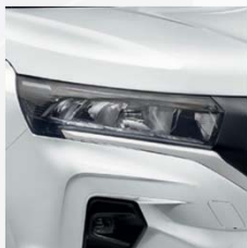
Mineral White (QNG)