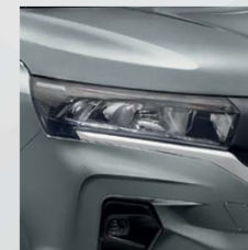
Casiopee Grey (KNG)