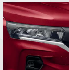
Carmin Red (NPF)