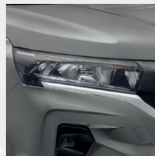
Highland Grey (KQA)