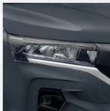
Urban Grey (KPW)