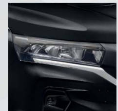
Black Metal (GNE)